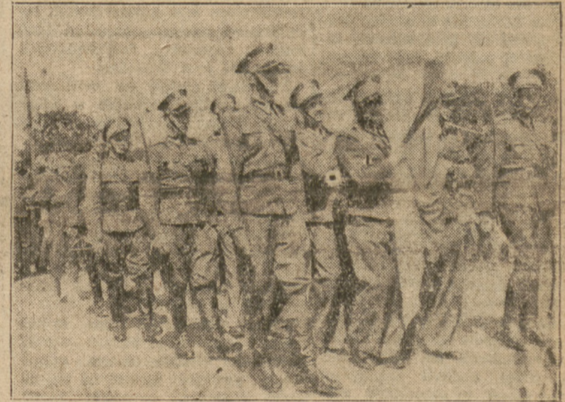
Wojownicy i żołnierze wzięli udział w pogrzebie gen. Żeligowskiego.