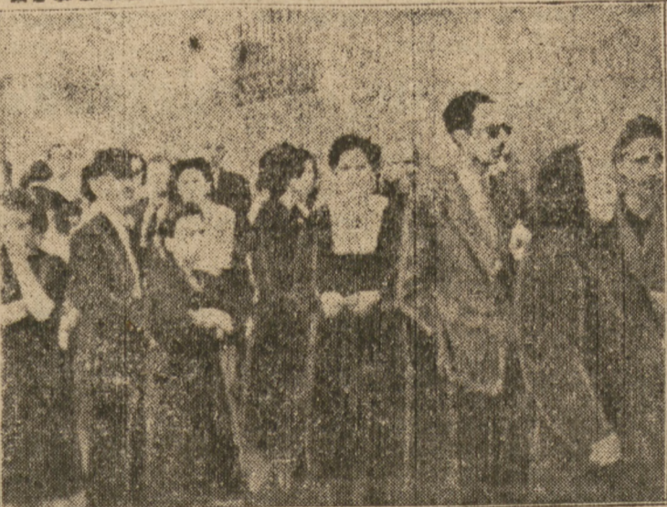
Winy głosujących są na ogół pozytywne i widak że wyborcy nie przysięgają do urn z entuzjazmem.

„Giełda amerykańska na Wall Street chce dać pierwszeństwo Niemcom”.