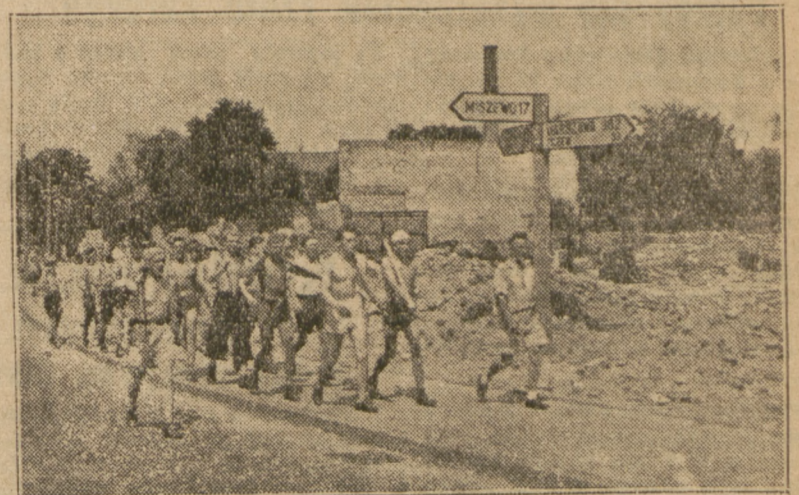
Młodzież przebywająca na wczasach kilka godzin czasu poświęca na pracę. Na zdjęciu grupa harcerzy spędzających wakacje nad morzem.