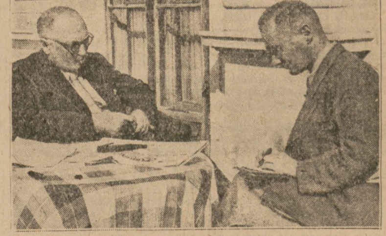
Tow. Pietro Nenni udziela wywiadu współpracownikowi „Robotnika”