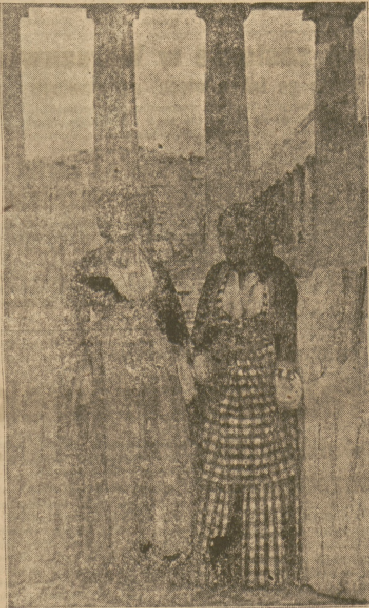
Grecja dla cudzoziemców

ministerstwami, plac ujmują w ramy najważniejsze arterie miasta: aleja Królowej Zofii, ulica Uniwersytecka (dziś Churchilla), wreszcie wychodzą nań okna wspaniałych hoteli King George'a i Grande Bretagne.