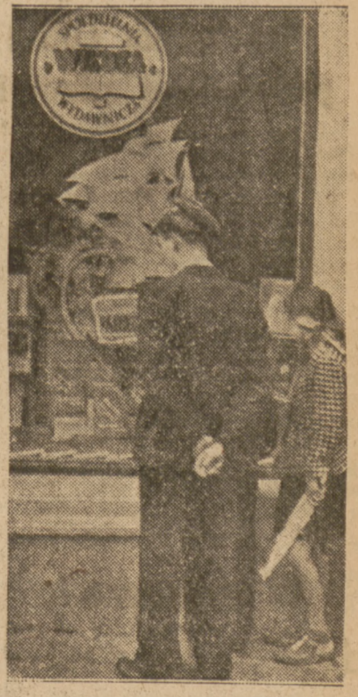
Rok szkolny rozpoczyna się. Młodzież żywo interesuje się książkami i zainteresowaniem ogląda wystawy księgarskie.

Stolica Związku Socjalistycznych Republik Rad — Moskwa obchodzić będzie w najbliższych dniach wielki jubileusz 800-lecia istnienia. Z Polski w uroczysto-