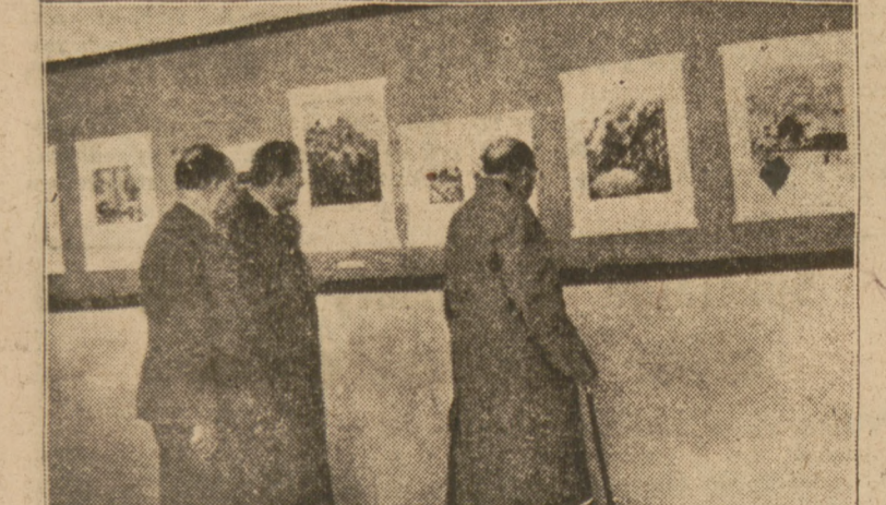
Warszatek Sejmu Kowalski, wicepremier Korycki i min. Putek na otwarciu Wystawy „Współczesna Grafika Czechoślowackiej“ w Muzeum Narodowym w Warszawie.