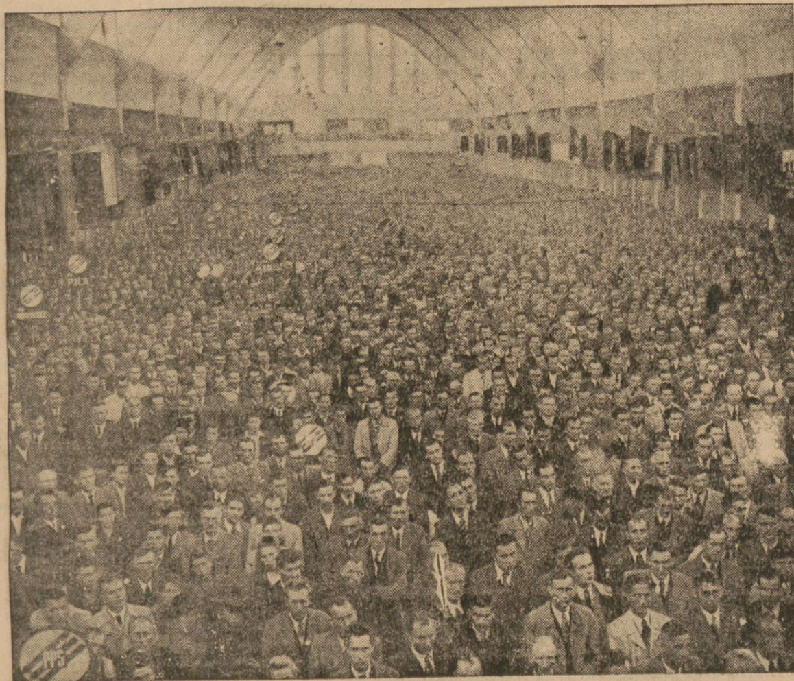
Widok ogólny na halę ciężkiego przemysłu Targów Poznańskich podczas wielkiego ulicznego zgromadzenia Polaków Partii Socjalistycznej

Równolegle rozwija się kryzys w łonie partii socjalistycznej, której sekretarz generalny Guy Mollet podtrzymuje swe żądanie zgłoszenia przez rząd przed końcem sesji projektu ustawy, odpowiadającej programowi gospodarczemu, uchwalonemu przez kongres socjalistyczny.