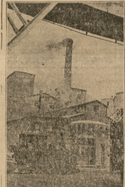
Z potężnego kompleksu gmachów „Solvaya” soda wyrusza w świat.