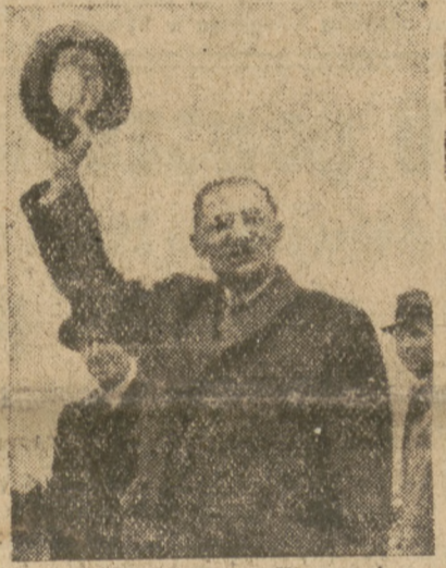
Tow. Fierlinger w Warszawie