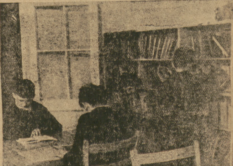
Spotkanie RTPD na Żoliborzu

Specjalne rozporządzenie Rady Ministrów określi szczegółowo zakres współdziałania związków zawodowych w powyższych sprawach. Ruch zawodowy, a zwłaszcza Zw. Zaw. Prac. Państwowych, od dawna zabiegał o prawne uregulowanie tego zagadnienia.