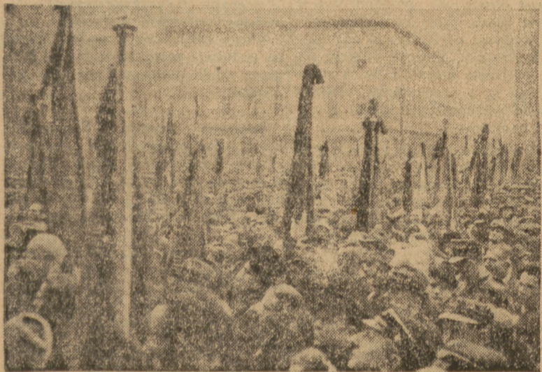
Wielka manifestacja na rynku w Krakowie ku czci Ignacego Daszyńskiego