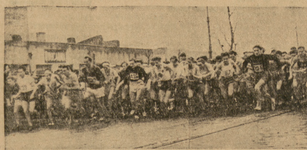
161 zawodników rusza ze startu

światy i kultury najszerszych mas ludowych. Aby iść szybko na przód, aby wydobyc się z ponurej spuścizny zniszczeń i zaoferania, aby utworować narodową wolną drogę pełnego rozwoju jego sił twórczych, konieczny jest rozwój nie tylko przemysłu i rolnictwa, konieczny jest również szybki rozwój oświaty, nauki, kultury i sztuki, konieczny jest równoczesny rozwój pełnych potrzeb materialnych i duchowych człowieka. Cechą znamienne, przeżywanego przez nas okresu jest to, że nie wybrane tylko warstwy i wyjątkowe tylko postacie, nie indywidualni