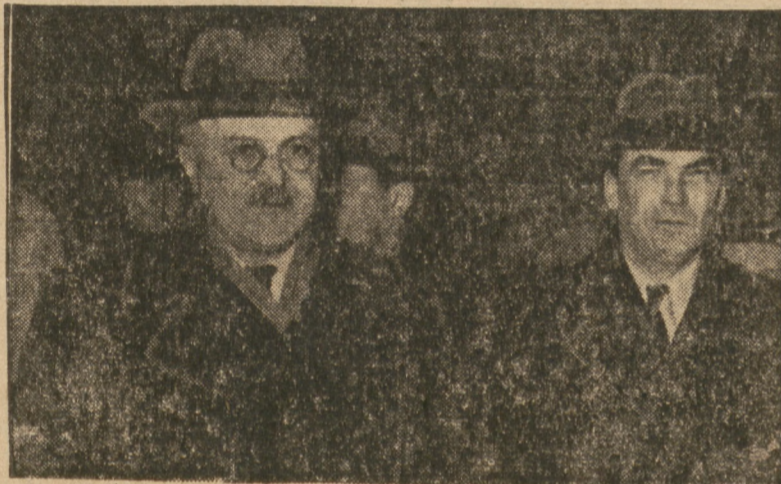
Min. Mołotow z ambasadorem radzieckim w W. Brytanii Zarinem przybywa do gmachu w którym odbywa się konferencja Ministrów Spraw Zagranicznych Wielkiej Czwórki.