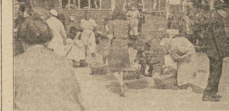
w upalny dzień czerwcowy

Rzeczywiście, nie jest wykluczone. O ile mnie pamięć nie myli, to wła- śnie w „Przekroju” czytałem o kon-