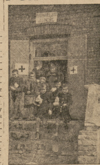
Kolumna PCK korzysta z gościnny posterunku M. O. w czasie pobytu w małym miasteczku gdzie rozdzielano dary dla dzieci