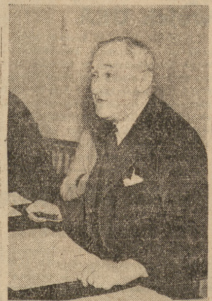
Przewodniczący egzekutywy Partii Pracy. Patrz korespondencja na str. 3.

Wicekról Indii wyjaśnił przywódcom partii szereg zagadnień wpływających z projektu podziału Indii.