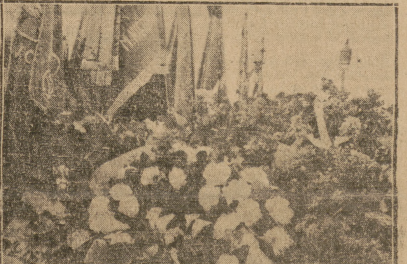
Grób tow. Niedziałkowskiego obsypany kwiatami. Obok widoczne poczty sztandarowe.