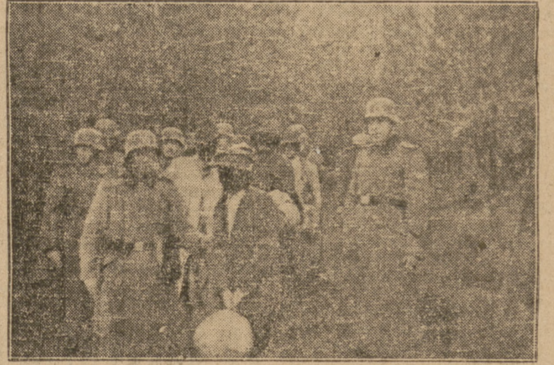
Autentyczne zdjęcie z okresu okupacji znalezione przy zabitym policjancie niemieckim pobazuje grupę Polaków prowadzonych na rozstrzelanie.