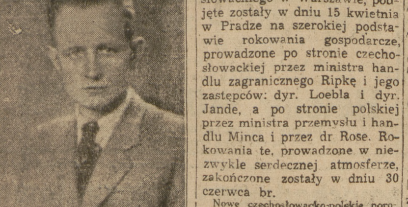
ANTONI GOTTWALD socjalista czeński, z którym wywiad zamieszczamy na str. 3.

Na czele delegacji, w skład której wchodzi szereg ministrów, stoi premier tow. Cyrankiewicz. Pobyt delegacji polskiej w Czechosłowacji przewidziany jest na okres 3 dni.