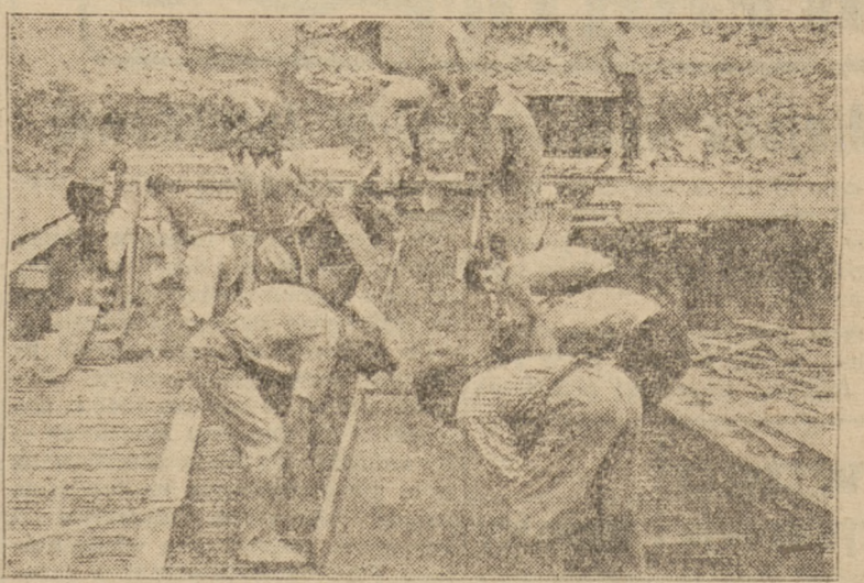
Jedną z największych robót inwestycyjnych w stolicy jest rozbudowa tunelu linii średnicowej, biegnącego pod Alją Sikorskiego. Tunel obliczony na 2 tory, poszerza się do czterech torów. Jest to podstawowa praca gwarantująca zdrowy rozwój powstającej z gruzów Warszawy.

Zbiory zapowiadają się dobrze Ziemie w okolicy Nysy należą do bardzo urodzajnych. Osadnictwo na tych terenach zostało już zakończzone. Przejedzając pociągami widzi się wszędzie bujne tany zboża. Nie ma tu ani kawałek ugoru. Urodzaj również dopisał. Mroz i susza jakos szczęśliwie nie zrobiły większych szkód na Dolnym Śląsku. Rowiat nyski będzie miał w tym roku poważne nadsztyki w zbiorach. Największą bolączką wsi jest w dalszym ciągu brak koni i krow. natomiast z trzodą chlewną jest już zupełnie dobrze. Ostatnio na targach w Nysie zakupywano świnię nawet do centralnej Polski. Zarówno wieś, jak i miasto dotkliwie odczuwają brak szkła. Lüksiem jest, jeśli oszkłone są wszystkie zewnętrzne okna, przeważnie zresztą tymczasem. Szkła w Nysie nie można nabyć nawet na lekarstwo. Zarząd miejski czasami dostanie skąpy przydział, na który czeka długa lista zamówień. Jednocześnie w niedalekim, o 100 kilometrów oddalonym Wałbrzychu, huta „Luzitanka” musiła zredukować robotników. Bo wszystkie magazyny, a nawet wielki park przy fabryce, zawalony jest dziesiątkami tysięcy szkła okiennego.