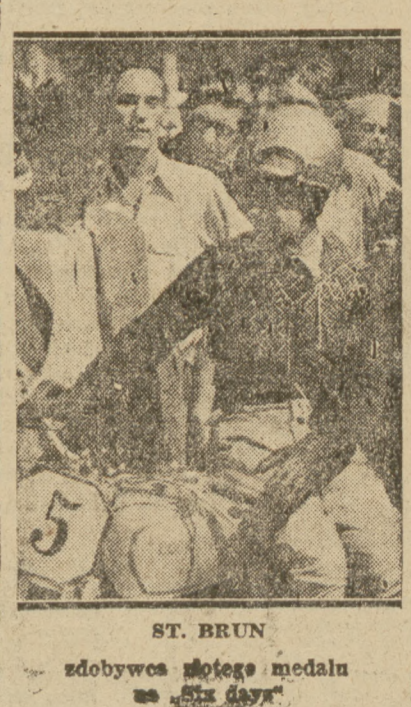
ST. BRUN zdobywca złotego medalu na „Six days”

Czechosłowacja-Rumunia 6:2 BUKARESZT (SAP). Rozegrano dziś zawody międzypaństwowe w piłce nożnej Czechosłowacja — Rumunia zakończyły się zwycięstwem Czechosłowacji 6:2 (3:2).