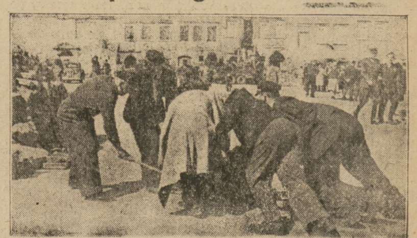
Patrz reportaż na str. 3-ej