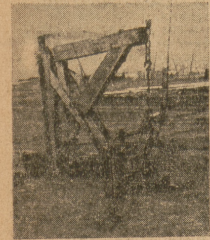
Tac wygląda jeden z szybów w Lipinkach. Ramiona dźwigni połączone z pompą ssąco-tłoczącą...