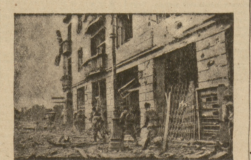
Wojska radzieckie i „Kosciuszkwowcy” na ulicach Pragi w grudniu 1944 r.