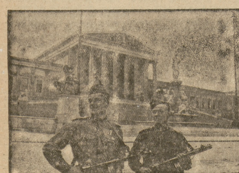
Pierwsza straż przed gmachem parlamentu w zdobytych Wiedniu

Kraj socjalizmu ucierpiał ogromnie od napadu faszystów, szybko jednak leczący swe rany, koncentrując wszystkie siły na pokojowym budownictwie. ZSRR ma obecnie nieporównanie większe możliwości doskonalenia swego sprzętu i techniki wojennej. Pomiedzy współczesną armią radziecką a pierwszymi oddziałami Czerwonej Armii zachodzą wielkie różnice. Lecz nieśmiertelne tradycje robotników, żołnierzy i marynarzy, którzy walczyli na barykadach Października, żyją nadal w sercach radzieckich żołnierzy.