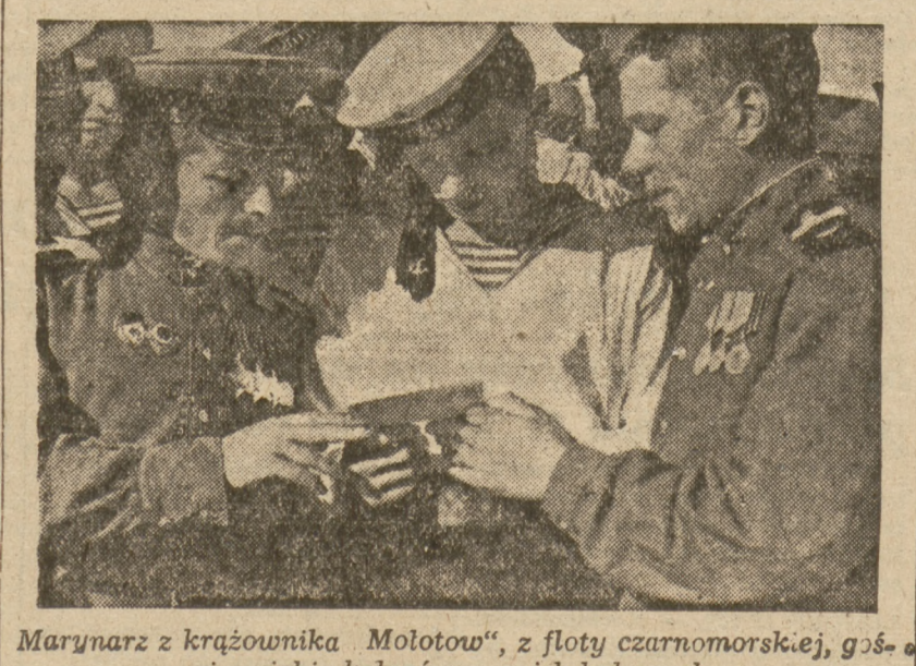
Marynarz z krążownika „Molotow”, z floty czarnomorskiej, gości u siebie kolegów z wojsk lądowych.

Czerwona Armia doprowadziła dzieło klęski wojsk hitlerowskich do końca, uwolniła Polskę i Czechosłowację spod faszystowskiej okupacji przyszła z pomocą Jugosławii, Norwegii i Danii, Finlandii, Bułgarii i Węgry obróciły w toku wojny swoje ostrze przeciwko Niemcom. „Teraz, kiedy wojna ojczyzna dobiega zwycięskiego końca — mówił Stalin 6 listopada 1944 r. — uwydatniła się w całej wielkości historyczna rola radzieckiego narodu. Wszyscy przyznają teraz, że naród radziecki uratował swą pełną po-