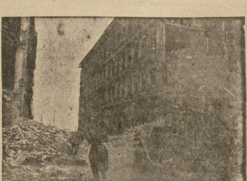
Wkroczenie czołówek Armii Czerwonej do Berlina

Narody Związku Radzieckiego śledzą bacznie działalność podlegających wojennych, aby uchronić się przed jakimikolwiek niespodziankami. Doświadczenie drugiej wojny światowej wykazało, do jakich zubożnych następstw prowadzi agresja państw imperialistycznych. Doświadczenie to wykazuje także coś innego: przewagę obozu wolności nad obozem imperializmu. Olbrzymie ilości środków technicznych w wojnie współczesnej wymagają kolosalnych rezerw ludzkich. Ostatnia wojna potwierdziła jeszcze dobitniej niż poprzednie, że w końcowym efekcie decydują ludzie, a nie maszyny. Radziecki człowiek, zahartowany pracą socjalistyczną, okazał się bardziej zdolnym do przyswojenia sobie arkanów techniki bojowej. Okazał się również zdolniejszym do wytwarzania lepszych typów maszyn wojennych i uzbrojenia. Nic więc dziwnego, że armia radziecka zdumiała wszystkich swym uzbrojeniem i umiejętnością władania nowoczesnymi środkami walki.