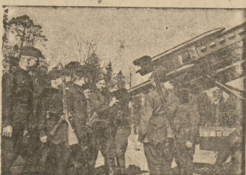
Żołnierze gwardyjskiego oddziału miotaczy min przy swojej „Katuszy”.

armii radzieckiej ma zrozumienie wpływu tzw. czasowych i stale działających czynników wojny. Agresor może z początkiem wojny uzyskać pewną przewagę taktyczną w rezultacie nagłego napadu na oddzielne małe lub s’abe państwa. Przewaga ta może nawet przynieść decydujący sukces. Jednakowoż przeciwko tak potężnemu państwu, jak Związek Radziecki, przeciwko koalicji państw miłujących pokój, czasowa przewaga militarna wroga nie ma decydującego znaczenia. Rozstrzygają wtedy stale działające czynniki: zwartość tyłów, moralny duch armii i organizacyjne zdolności dowództwa.