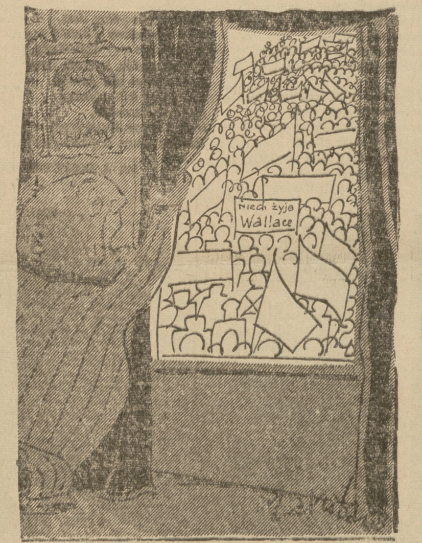
1 Maja w krainie dolara Rys. Jerzy Zaruba