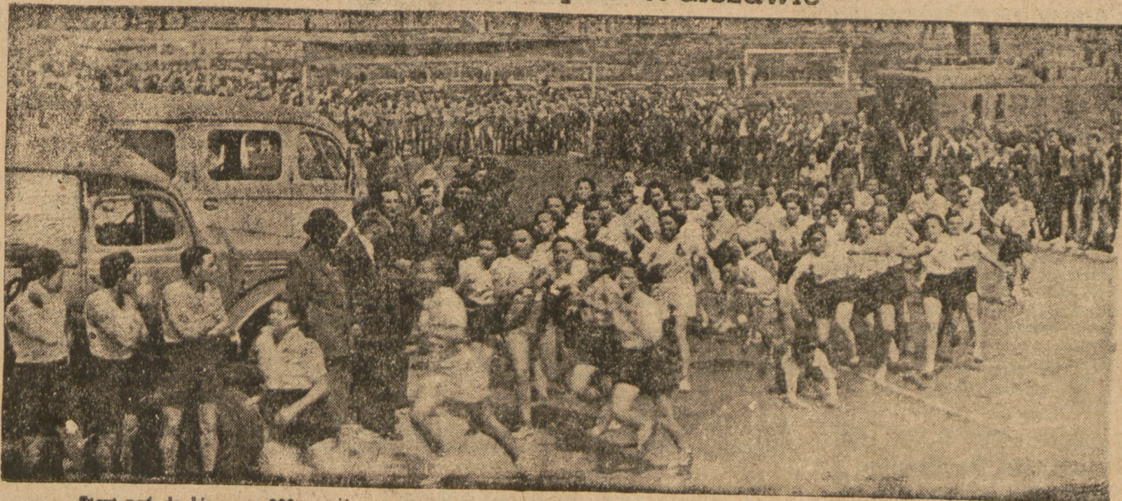
Stani pod drzwiami na 300 metrów. W sali zgrupowani oczekujący na start do biegu na 2000 metrów

OSLO (SAP). Do Bergen przybyła amerykańska eskadra okrętów wojennych. Poseł Stanów Zjednoczonych w Norwegii oznajmił, że odwiedzą te są „demonstracją gotowości USA do obrony Norwegii”. Jeden z dzienników wychodzących w Oslo komentując ten epizod pisze: „Byłoby dobrze, gdyby poseł amerykański, raz nareszcie zrozumiał, gdzie się znajduje, Norwegia, to nie Kolumbia a Bergen nie jest Bogotą. My, w Norwegii, przywykliśmy decydować sami o sprawach dotyczących naszego życia i naszego kraju i mamy o wszystkim swoje własne zdanie. Odwiedźmy okrętów wojennych — podkreśliła gazeta — to nie jest droga do pokoju i wolności”.