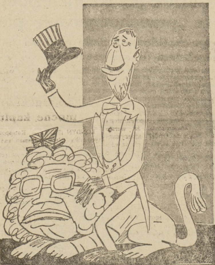
Sukcesy tresury Marshallowskiej