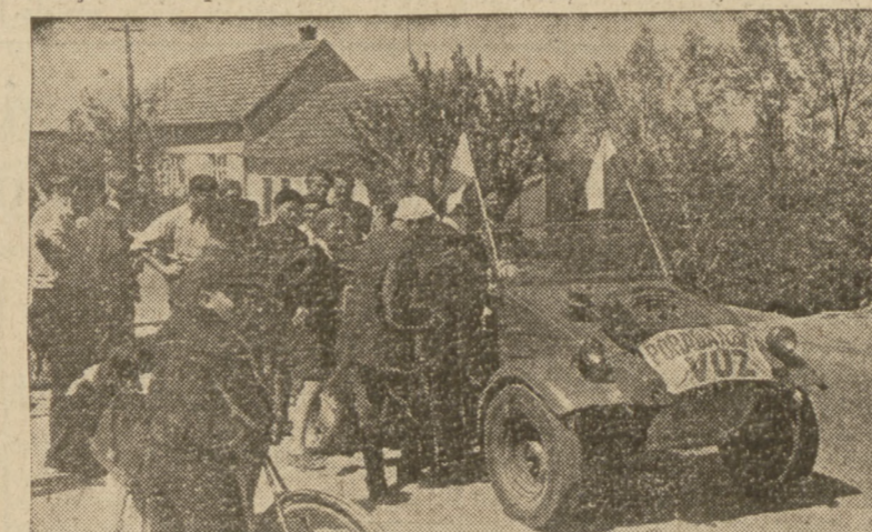
Na zdjęciu: samochód sprawozdawcy „Robotnika” w czasie postoju na trasie wycieczki

Czasami pewne wrażenia ryją się w pamięci kolorami a 1 Maja w Czechosłowacji zawsze zostanie dla mnie