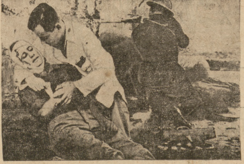
Na zdjęciu: Lekarz żydowski udziela pierwszej pomocy rannemu żołnierzowi Haganah. Wolne państwo Izrael powstaje z krwi Żydów walczących o niepodległy byt.