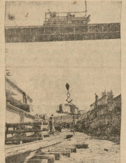
Dźwig portallowy podnosi belkę wagi 18 ton

Własnie potężny dźwig portallowy podnosi belkę żelazną wagi 18 ton.