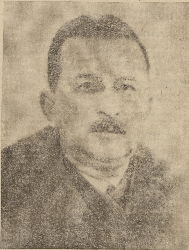
Poległ w Palmirach 21 czerwca 1940 roku