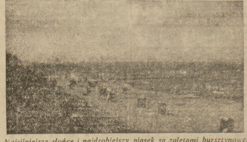
Najświeższe słońce i najdobry piasek są zaletami bursztynowego brzegu w Ustroniu