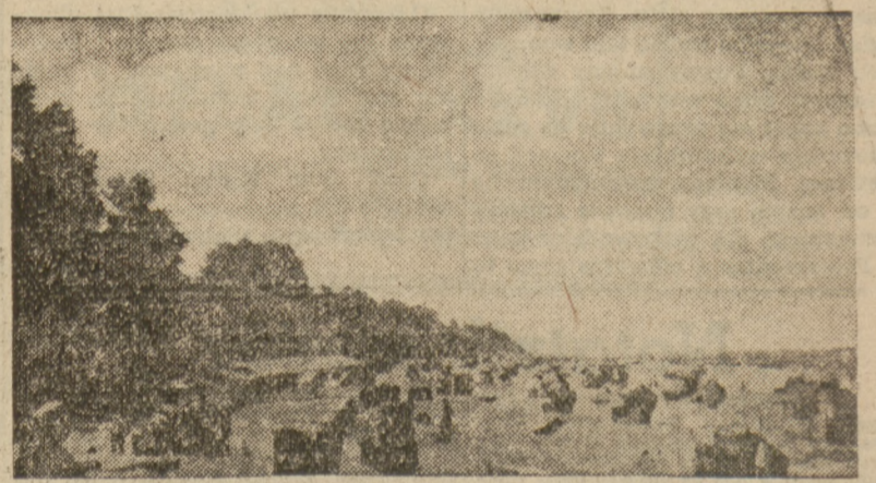
Oto szeroki, jasny pas plaży w Niechorzu, gdzie największa lampa kwarcowa — słońce — bezpłatnie nasświetla setki pacjentów