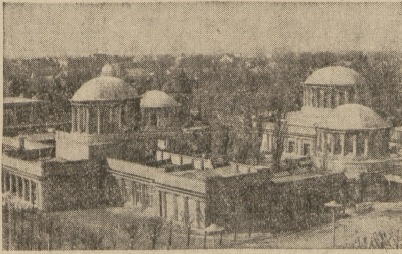
Odbudowany „pawilon czterech kopuł”, będzie głównym gmachem wystawy