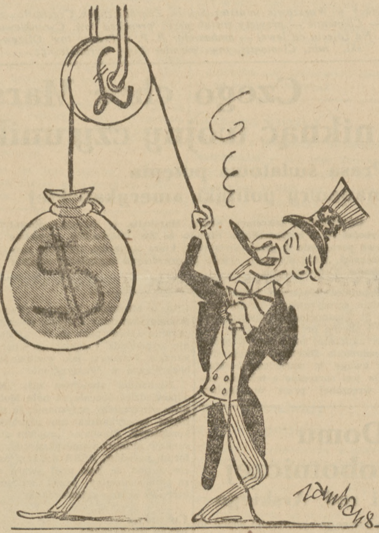
Wielka Brytania zgodziła się na przyjęcie przez Stany Zjednoczone kontroli nad blokiem szterlingowym