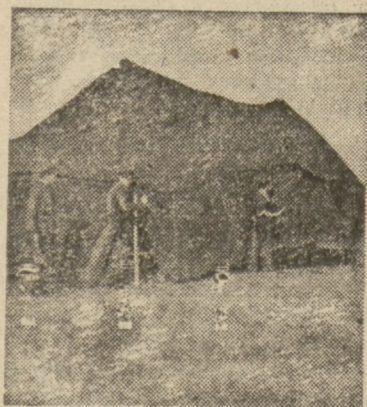
„Służba Polsce” rozbita namioty w pobliżu Bielinka

Jeszcze w Szczecinie jeden z inżynierów SPB obiecywał solennie, że jadąc nad Odrę, do Bielinka,