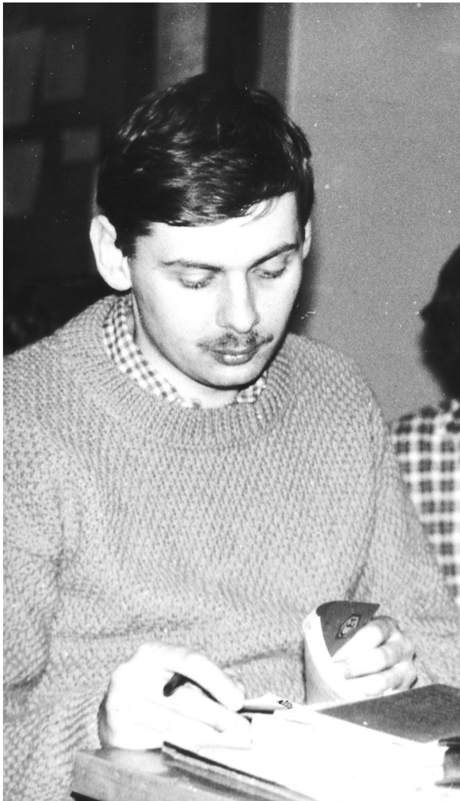
Autor, Łódź, marzec 1985 r.