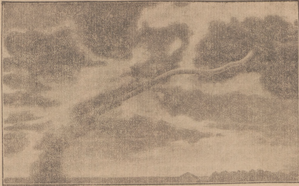
So sieht ein Tornado aus

Während im letzten Krieg der Gasangriff sich in der Form des Gasverfahrens oder Gasstießens, in der Verwendung von Hand- und Gewehrgranaten abspielte und die Gasangriffe aus der Luft äußerst selten und wenig wirkungsvoll waren, scheint der chemische Angriff, zumal in Amerika, als die wirksamste Waffe der Zukunft betrachtet zu werden. Der von Bertha von Suttner vorausgesehene „Barbarismus der Luft“ ist somit im Anzuge und gleichsam greifbar geworden. Die Zivilbevölkerung wird von ihm nicht verschont bleiben. Es ist berechnet worden, daß zur Vergiftung von Berlin 1000 Dreitonnenwagen Senggas genügen würden. Darum haben auch die verschiedensten Länder, wie wir schon unlängst berichten konnten, bereits dem Gaschutz der Zivilbevölkerung große Aufmerksamkeit angedeihen lassen. Wobei die von uns herangezogenen Autoren in dem Gaschutz der Zivilbevölkerung kein unlösbares technisches Problem erblicken. Im britischen Unterhaus wurde der Antrag gestellt, zum Schutze gegen