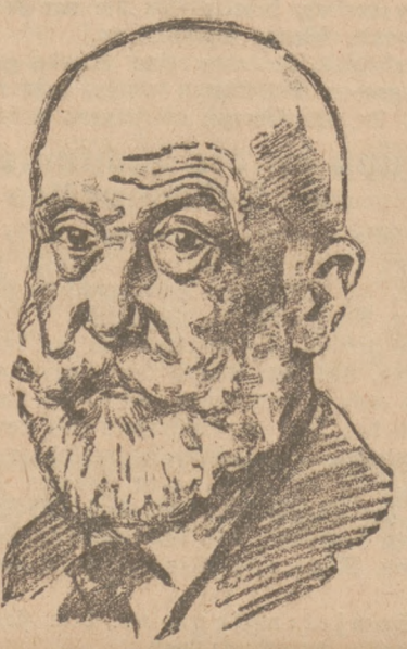
80 Jahre alt

wird am 1. September Professor August Forel, der berühmte schweizerische Psychiater und Sexualforscher.