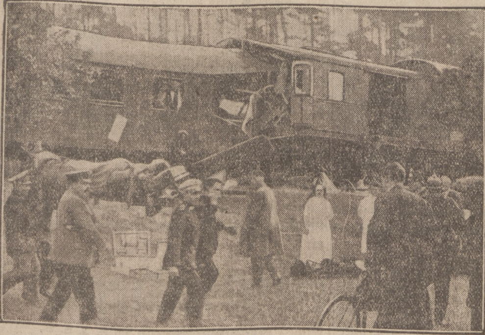
Sanitätsmannschaften, Ärzte und Krankenschwestern brachten den Verunglückten Hilfe.

an der Strecke Nürnberg—München, wo am 24. Oktober die D-Züge Nürnberg—München und München—Berlin gegeneinanderfuhren. Fünf Tote und 56 Verletzte sind als Opfer dieses schweren Unglücks zu beklagen.