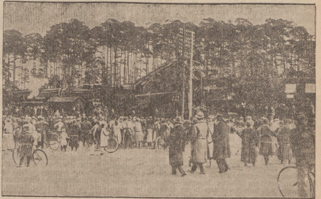
So sah es an der Unglücksstätte aus.