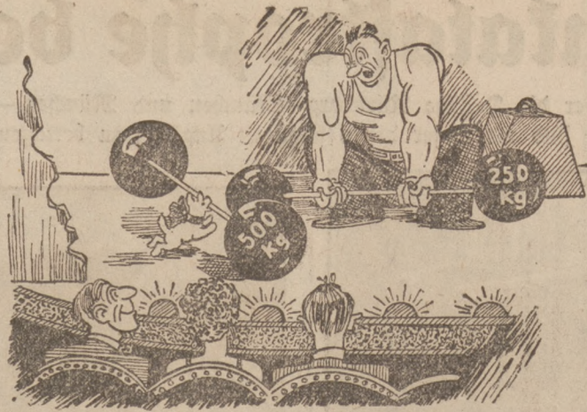
Wenn der Athlet vergißt, sein Hündchen während der Vorstellung einzusperrern. (Judge.)

Dienstag, 16.15: Schallplattenkonzert. 17.45: Unterhaltungskonzert. 19.20: Opernübertragung aus Kattowik.