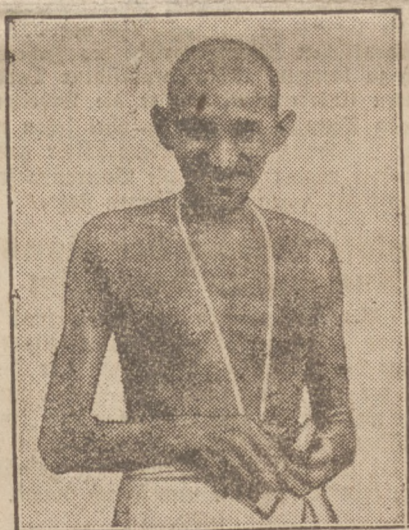
Gandhi führt Indien zum Entscheidungskampf?