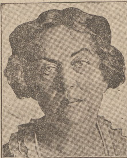
Zur Sowjetgesandtin in Stockholm ernannt

Gerüchte wollen wissen, daß die Geheimorganisationen militärischen Charakters in der letzten Zeit eine fieberhafte Tätigkeit entwickeln, um die Regierungskreise zu beeinflussen, endlich mit dem Sejm einen Schluß zu machen. Er soll aufgelöst werden und die neue Verfassung auf Grund von Dekreten erlassen werden. Erst dann sollen Neuwahlen stattfinden und zwar nach einer besonderen Wahlordnung, die von vornherein dem Regierungslager eine Mehrheit sichert. Die Führer der Geheimorganisation, die auch der Leitung des Legionärverbandes nahesteht, wollen auf der Tagung in Radom dahingehende Resolutionen unterbreiten, so daß Radom wieder einmal als Vorboten kommender Ereignisse und Entscheidungen betrachtet wird.