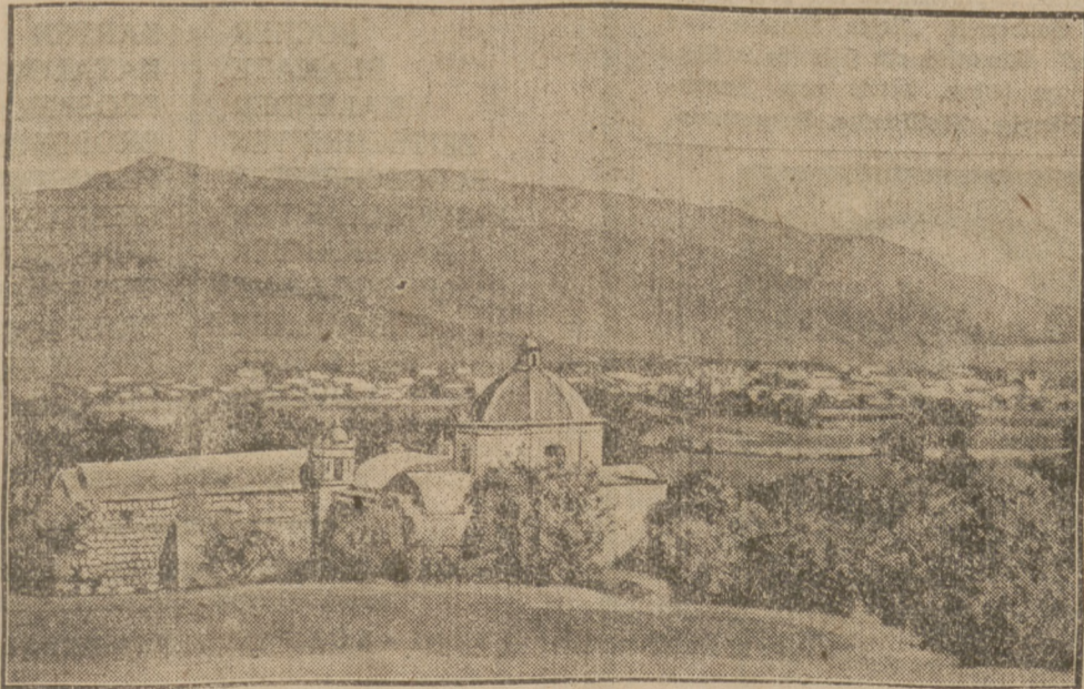
Durch Erdbeben in Trümmer gelegt