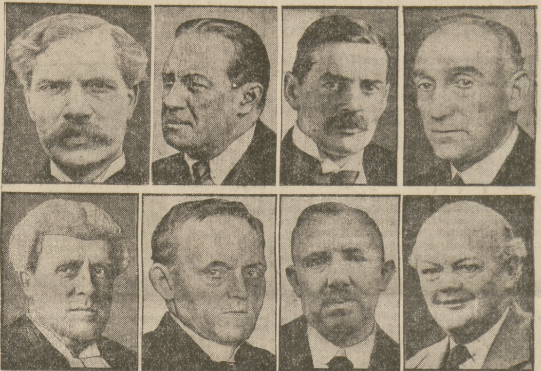
Oben: Ramsay Macdonald, Ministerpräsident; Baldwin, Geheimfiegelbewahrer; Neville Chamberlain, Arbeitsminister; Lord Reading, Staatssekretär des Neuhern. Unten: Sankey, Londkanzler; Snowden, Schatzkanzler; Thomas, Staatssekretär für die Dominien; Hailsham, Präsident des Geheimen Staatsrats.

Die genannten Organisationen werden sich jeden Angriff auf eine Abänderung der bestehenden Gesetzgebung hinsichtlich der Arbeitslosenversicherung auf das Entschiedenste widersetzen. Man rechnet damit, daß auf der am Freitag stattfindenden Vollversammlung der parlamentarischen Arbeiterpartei die Führer für den bevorstehenden Oppositionsfeldzug ernannt werden.