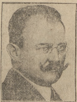
Gesandter St. Patel

Der russische Botschafter in Paris wird die französische Regierung über die Stellungnahme seiner Regierung zur Frage des Nichtangriffspaktes unterrichten.