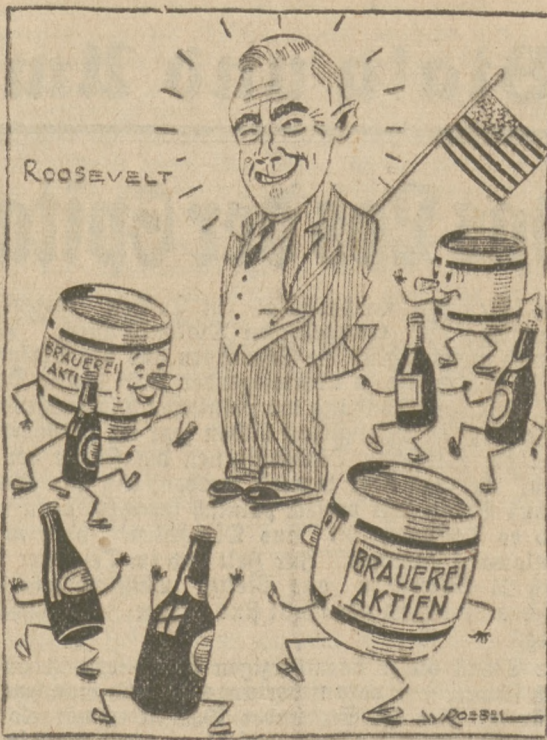
Die Brauerei-Aktionäre freuen sich über Roosevelts Sieg

8.20 Morgenkonzert; 8.15 Wetter, Zeit, Wetterstand, Presse; 13.05 Wetter, anschließend 1. Mittagskonzert; 13.45 Zeit, Wetter, Presse, Börse; 14.05 2. Mittagskonzert; 14.45 Werbedienst mit Schallplatten; 15.10 Erster landwirtschaftlicher Preisbericht, Börse, Presse.