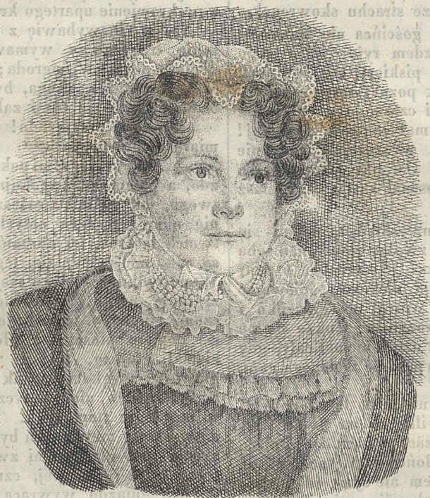
Ludwika z książąt pruskich Radziwiłłowa.

Szlachetność duszy, to prawdziwa wielkość: dowodem tego dostojna księżna. W prywatnym swem życiu pozyskała ona więcej może prawych czcicieli, więcej serc wielbiących i kochających ją szczerze, jak gdyby była na potężnym zasiadała tronie. Wskutek wzajemnej skłonności połączona z księciem Antonim Radziwiłłem, celującym świetnymi umysłu i ciała przymiotami, udała się po utworzeniu księstwa Poznańskiego z swym dostojnym małżonkiem, namiestnikiem królewskim, na mieszkanie do Poznania. Szlachetnością duszy, niewymowną dobrocią serca i rzadką uprzejmością, w krótkim czasie zjednała sobie księżna, miłość mieszkańców tutejszej prowincyi, którzy z uniesieniem wszędzie ją przyjmowali. Lecz najszacowniejszym jej pięknej duszy przymiotem, była dobroczynność: iluż to biednych uszczęśliwiła? ilu podźwignęła z niedostatku? ile łez otarła! ilu karmiła i zasilala hojną jałmużną? ilu nieszczęśliwym podała sposób do życia? Świadkiem tego jest cała ludność Poznania; co mówię? cała prowincya: nie masz bowiem kącika, gdzieby dostojna księżna nie zaślęnęła jakim dobrodziej-