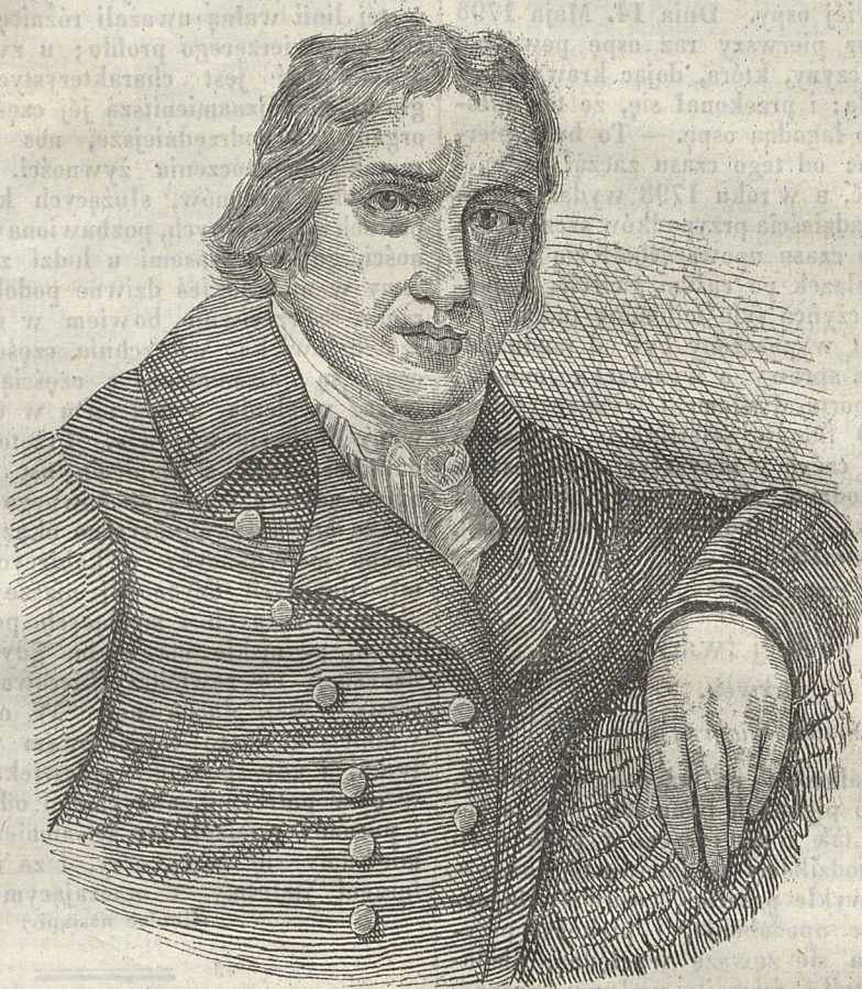
Portret Edwarda Jennera.