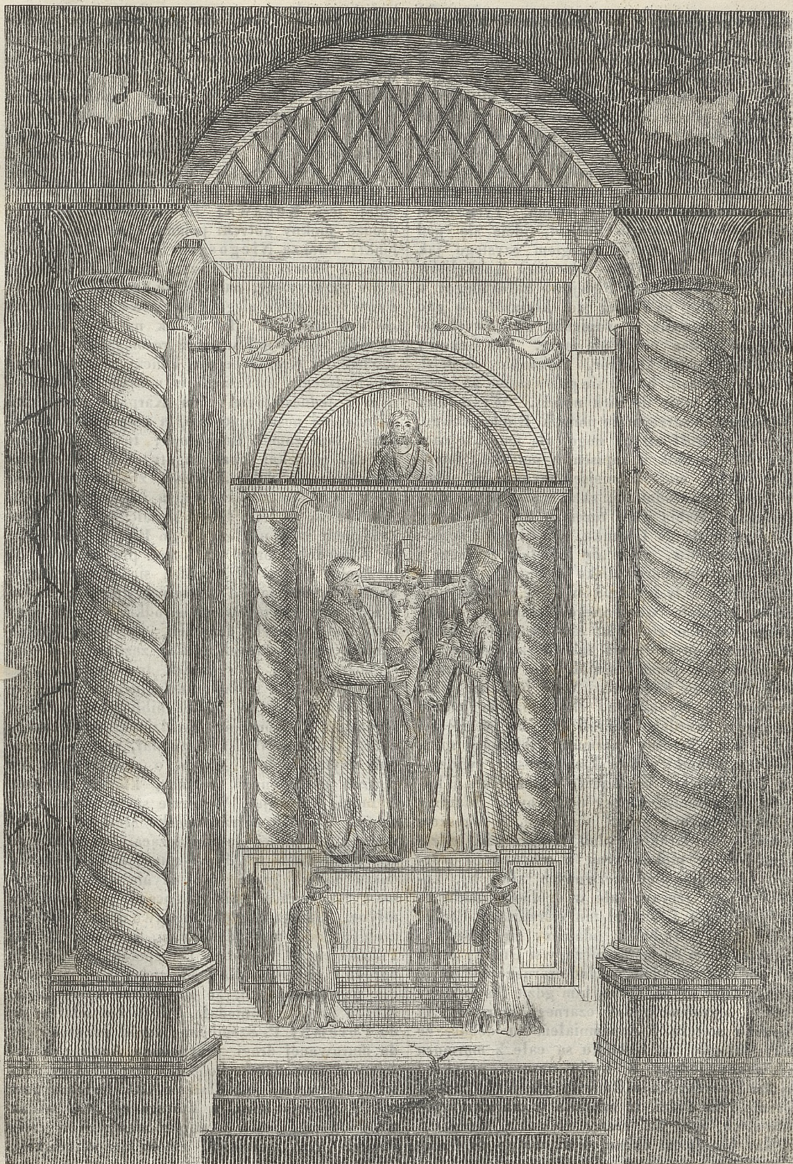
Ottarz z soli w kopalniach Wieliczki.