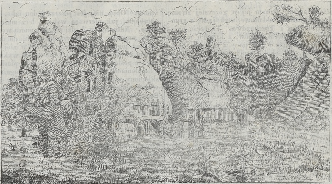
Ok. W. K. 1836. 18. Sokołowa w Polanicy