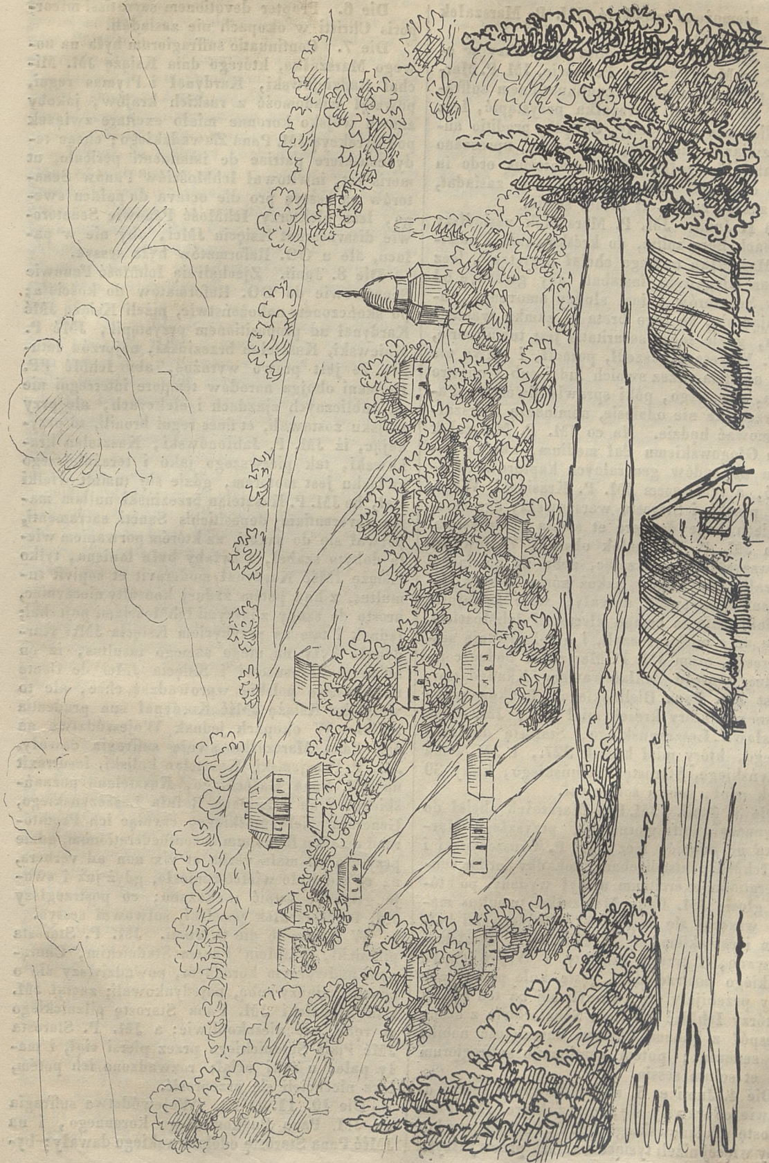
Widok wioski, czyli siedzib odosobnionych, na Podolu.