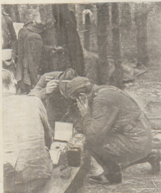
„Tu mówi Londyn” — codzienny nasłuch komunikatów w obozie.