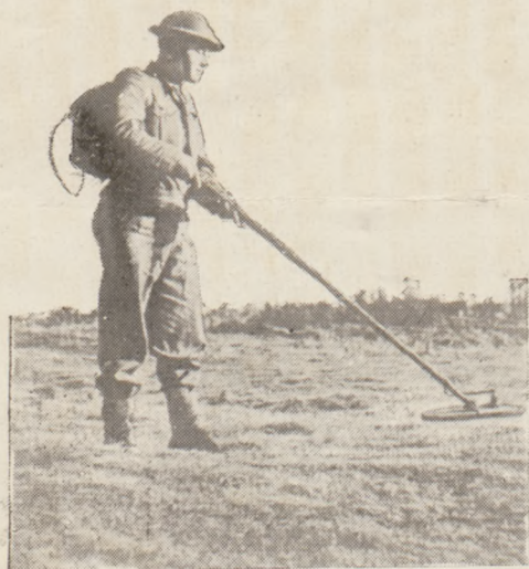
Polski saper w Anglii ze słynnym wynalazkiem naszych saperów, wykrywaczem min lądowych, który oddał wielkie usługi 8 Armji w Afryce Północnej.