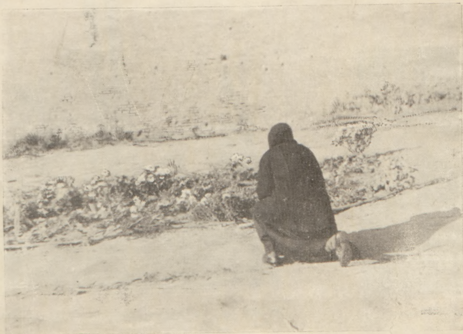
Najajutrz po egzekucji. Miejsce męczeńskiej śmierci za Wolność Polski pierwszych „zakładników” rozstrzelanych w Warszawie 16. X. 1943 w Al Niepodległości przy zbiegu ul. Madalińskiego.