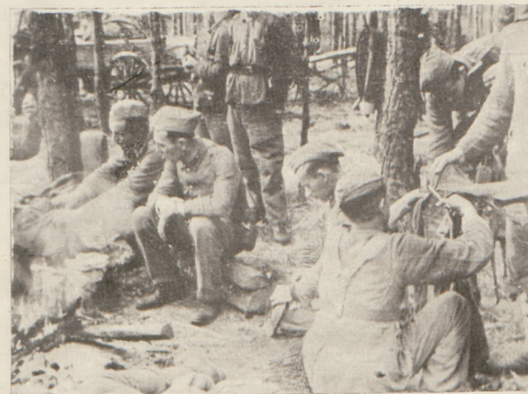
Na leśnej „Kwaterze”.