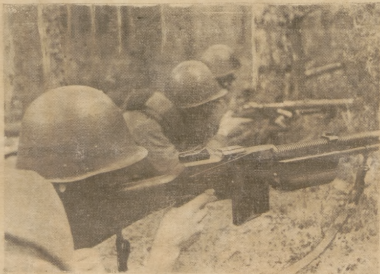
Na stanowiskach ogniowych. (Oddział partyzancki Armii Krajowej w Lubelszczyźnie.