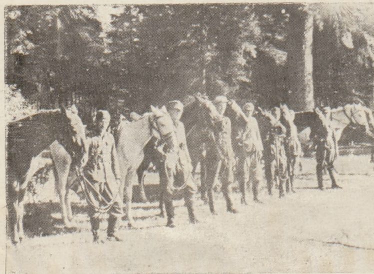
Z życia jednego z oddziałów partyzanckich Armii Krajowej.