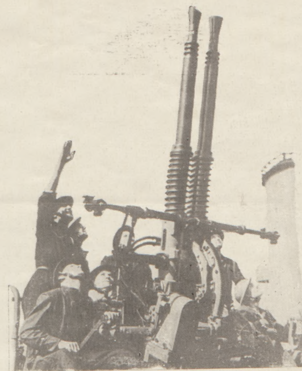
Działka opl. na polskim kontrtorpedowcu „Piorun”.