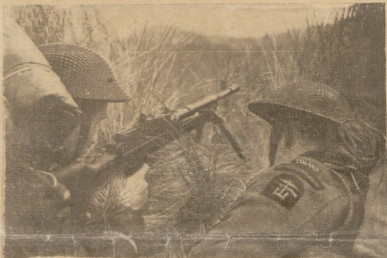
Przy r. k. m-ie. Ćwiczenia polskich oddziałów „Commandos” w Szkocji.