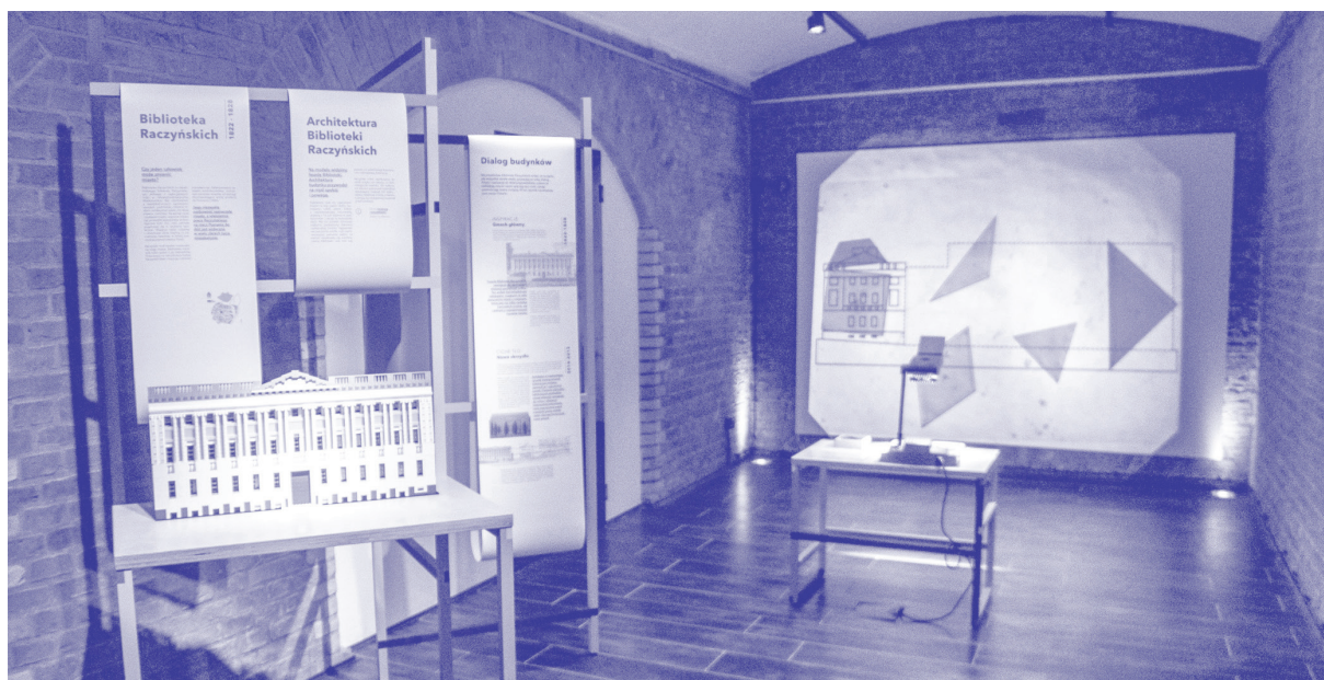
Fragment wystawy „Z klocków”, 2018, fot. Ł. Gdak, wł. CTK TRAKT

Projektanci nie zawsze stosują się do tej zasady, niektórzy wybierają zmianę i oderwanie od kontekstu.