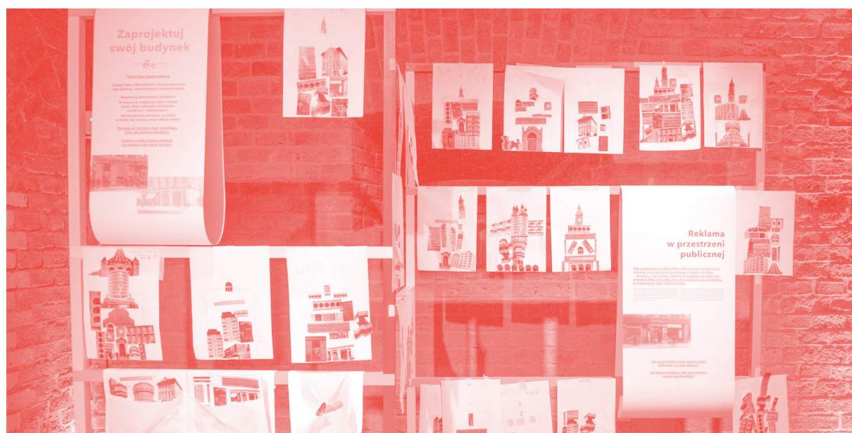
Fragment wystawy „Z klocków”, 2018