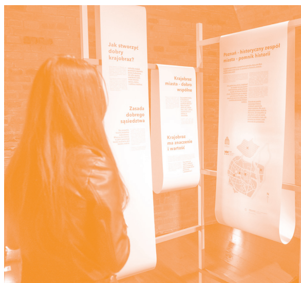
Fragment wystawy „Z klocków”, 2018

Czy wiesz, że czyste, zadbane ulice zmniejszają także akty przemocy i wandalizmu?