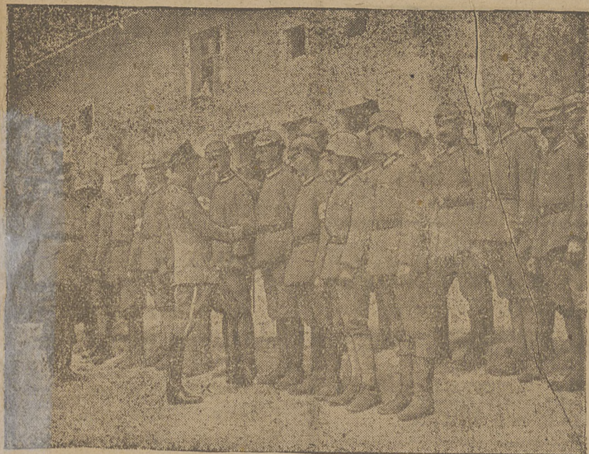
Następca trona Niemieckiego X robi przegląd patka i b wadzi 'picheoty' № 8.