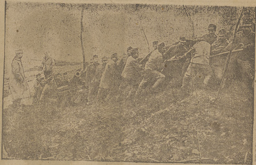
Transportowanie ciężkich austriackich moździerzy.

posuwa się do różnych nadżyć, a nawet okradania mieszkańców podczas nieobecności domowników, jakie się często zdarzają w ostatnich czasach — należałoby pomyśleć o zaprowadzeniu książek służbowych. Zaprowadzenie takich książek dla służby domowej na wzór Warszawy — wprowadziłoby pewną kontrolę, gdyż o każdym złym postępku i nadżyciu — wykazywałaby książka służbowa i byłaby jedynym świadectwem, mówiącym o sprawowaniu się danej osoby. Odnośnie władze winny się zająć zaprowadzeniem takiej kontroli, co jedynie wpłynie na alecczenie niesamiennej służby domowej.