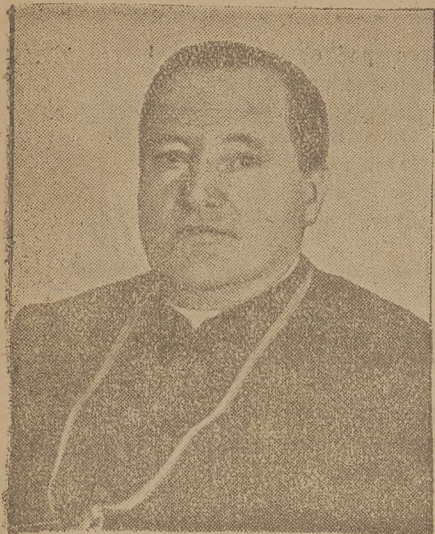
proboszcz Bawarii zmarł w 67 r. życia.