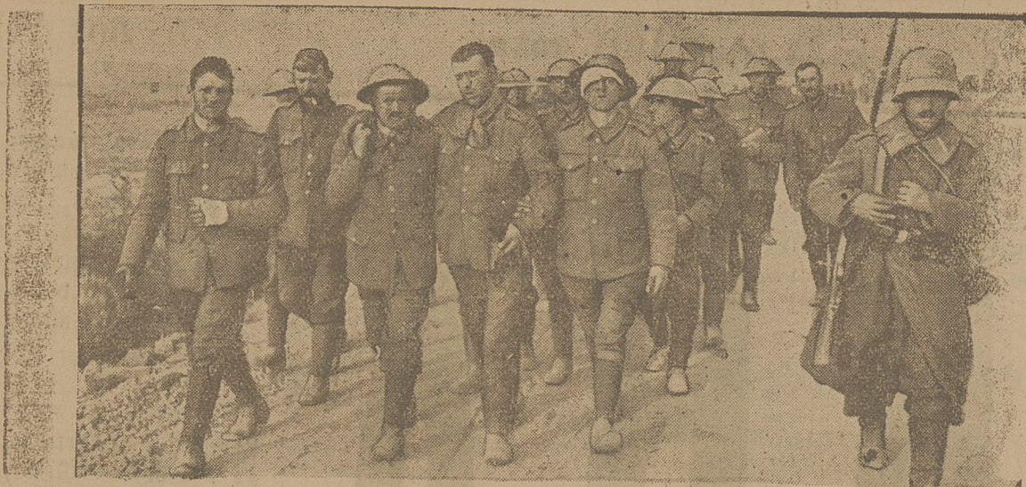
Transport jeńców angielskich wziętych do niewoli przez wojska niemieckie pod Arras.

denie narodowe rosyjskie, jak również i polacy nie są uprawnieni do przyjmowania udziału w decyzjach o wewnętrznym życiu Rosji. Przedewszystkiem jesteśmy obywatelami Polski.