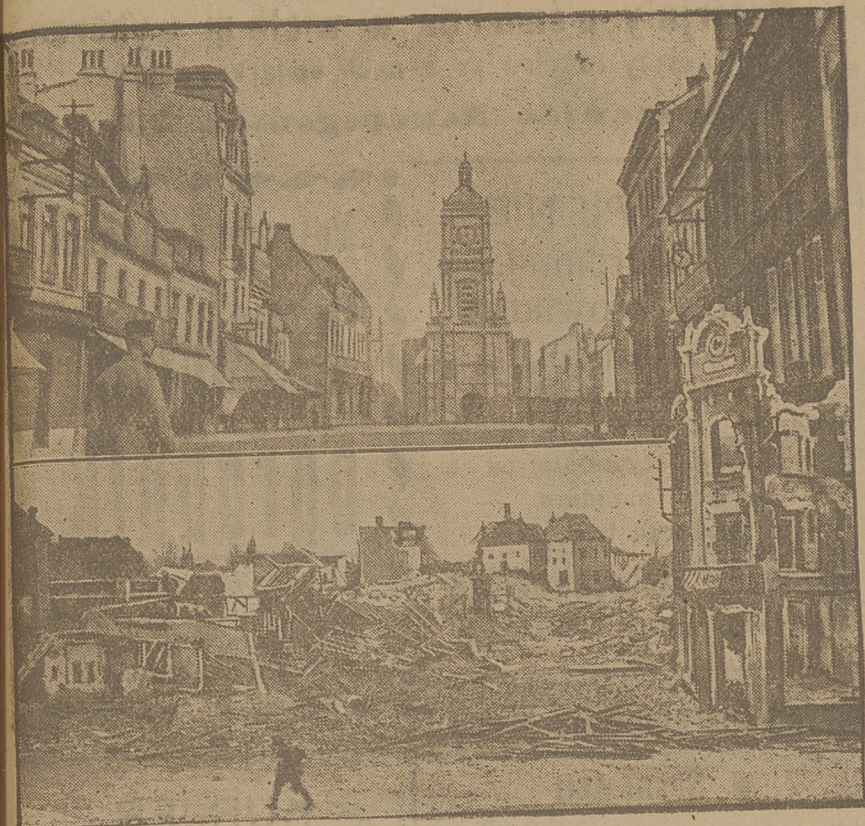
Obrazek przedstawia u góry: rynek miejski w Lens, u dołu: jedną ze zburzonych ulic.