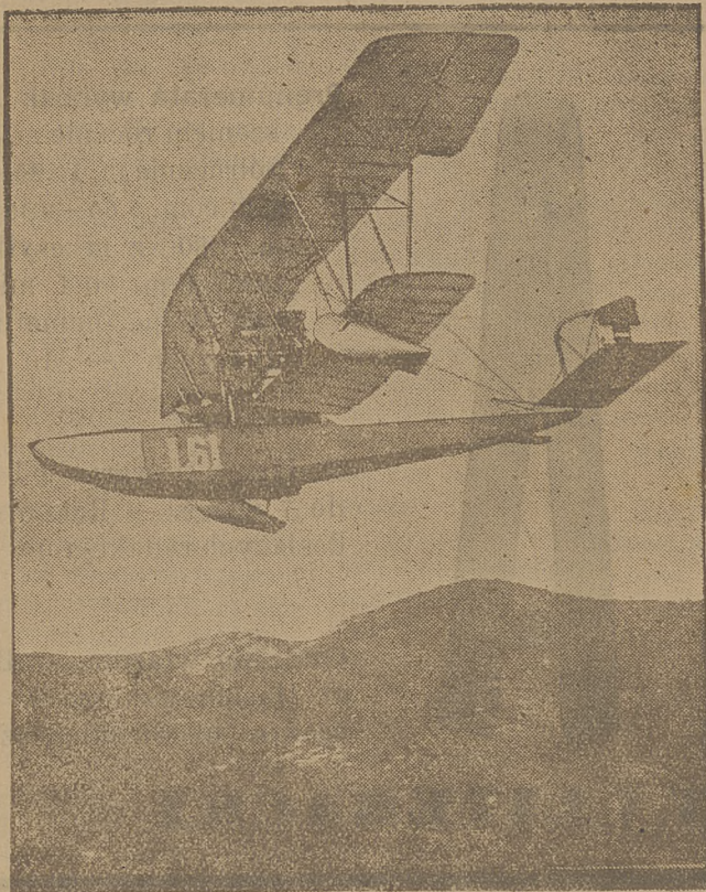
Austro - węgierski samolot podczas wlotu nad pozycjami nieprzyjacielskimi.