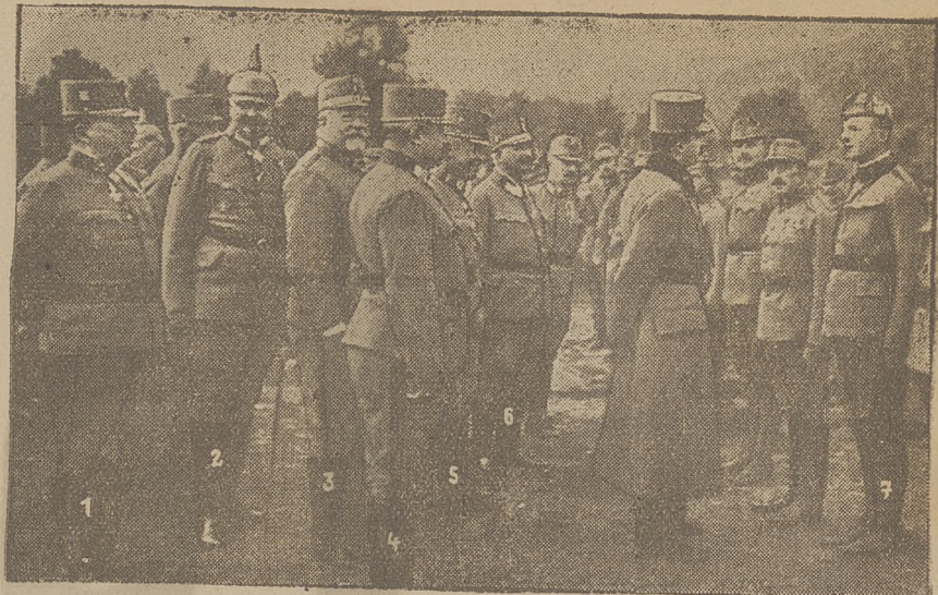
Na fotografii widzimy przyjęcie cesarza Karola w Kezdi-Vasarhely na froncie rumuńskim. (1) Szef sztabu generalnego, baron von Arz, generał piechoty; (2) pełnomocnik sztabu niemieckiego generał-major von Cramon; (3) fmlt. ks. Lobkowitz; (4) fmlt. Goldbach; (5) generał-pułkownik arcyksiążę Józef; (6) gen.-pułk. Rohr; (7) nadporucznik ks. Lobkowitz.

ko płaca, lub pensja dla utrzymujących rodzinę 3,000 mk. rocznie, dla samotnych 2,000 mk.;