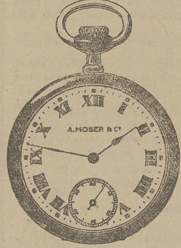
Oryginalny rozmiar zegarka.