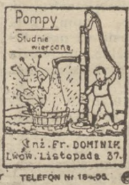
TELEFON Nr 18-05.