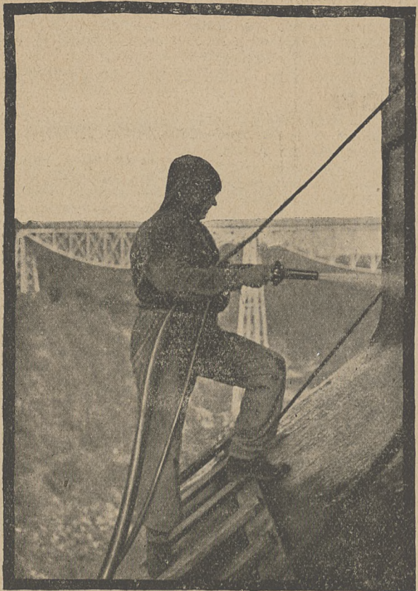
Natryskiwanie betonu sposobem „Torkret“